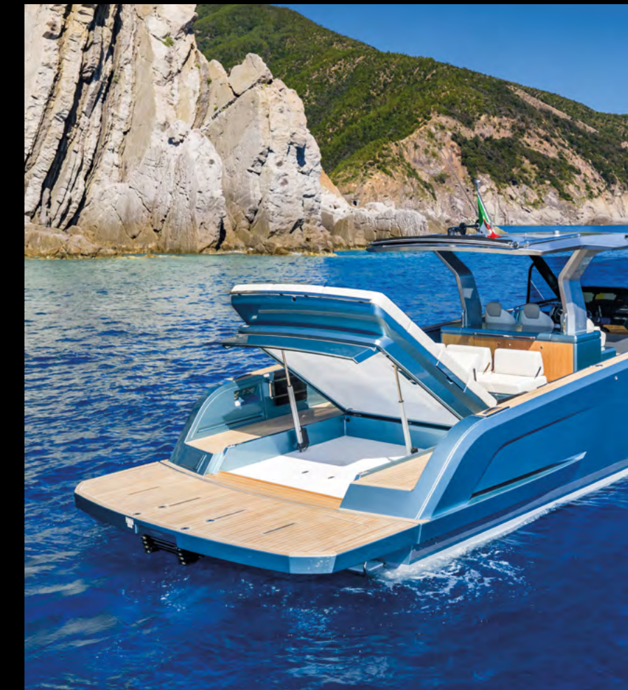
SPACIOUS TENDER GARAGE ALIGNED WITH SWIM PLATFORM / TENDER GARAGE AMPIO E ALLINEATO ALLA PLANCETTA