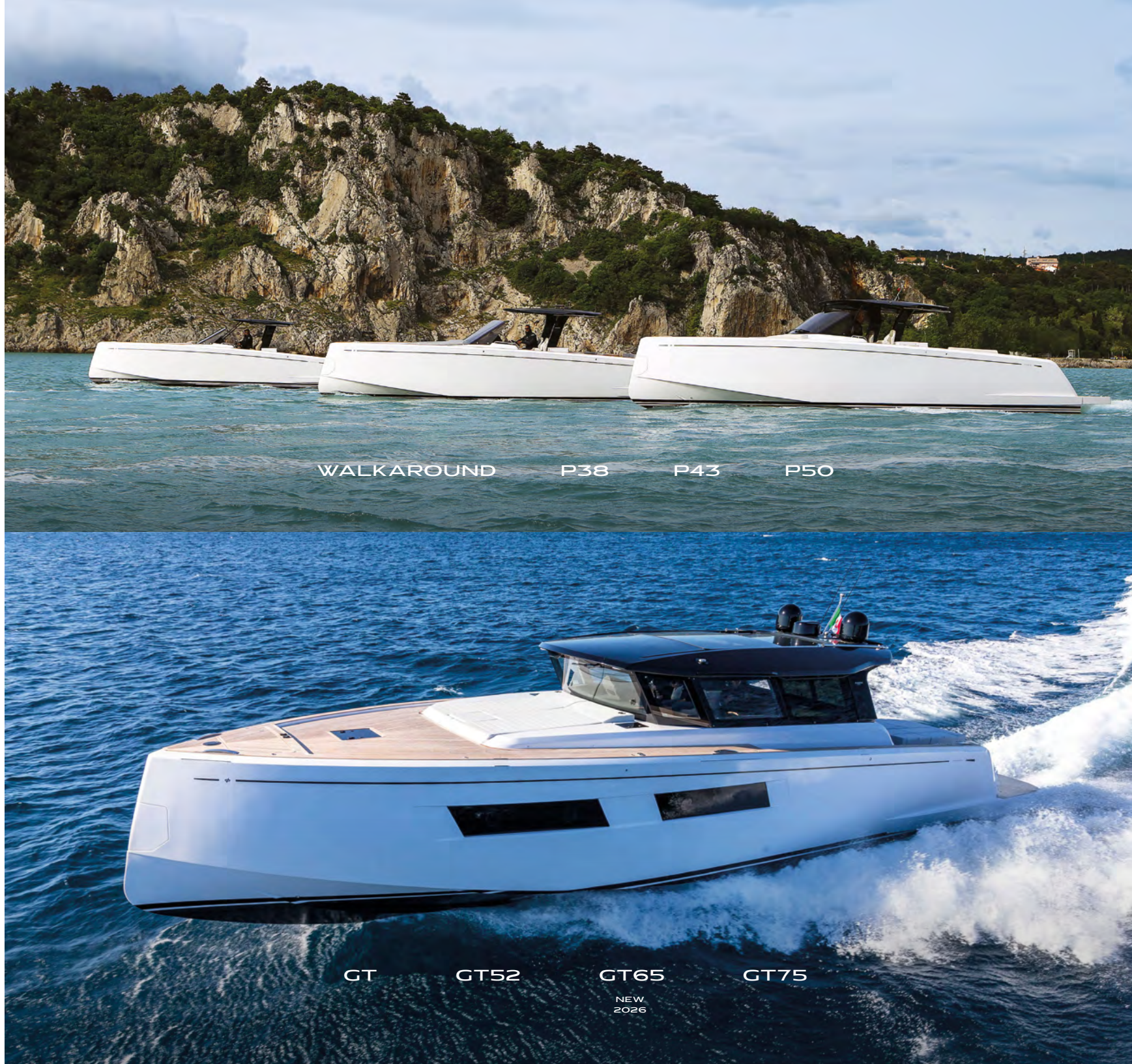
WALKAROUND P38 P43 P50

Una gamma che si va a posizionare tra la gamma Walkaround e quella Endurance rivolgendosi a un segmento di armatori alla ricerca di volumi ancora più vivibili e confortevoli rispetto agli attuali modelli walkaround, ma senza rinunciare alle performance.