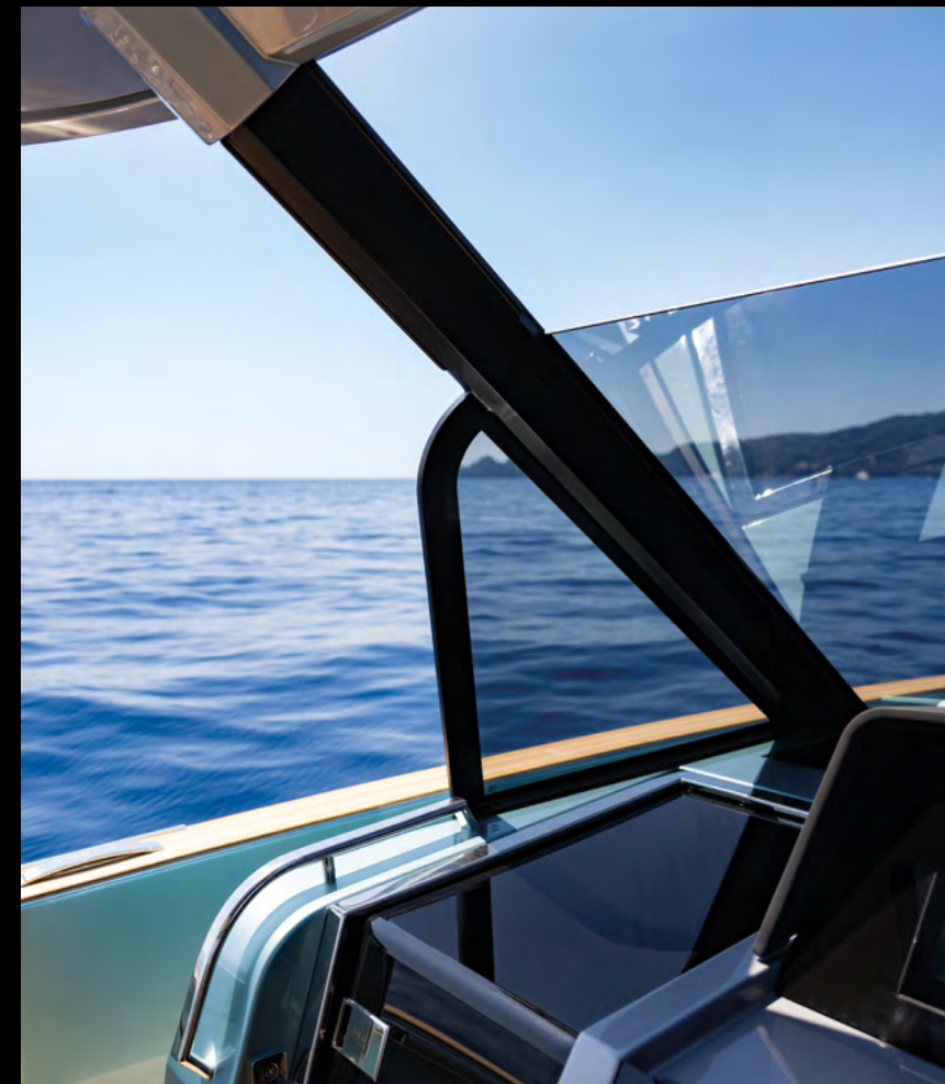
REDESIGNED CARBON T-TOP INTEGRATED WITH WINDSHIELD / T-TOP IN CARBONIO RIDISEGNATO E INTEGRATO AL PARABREZZA