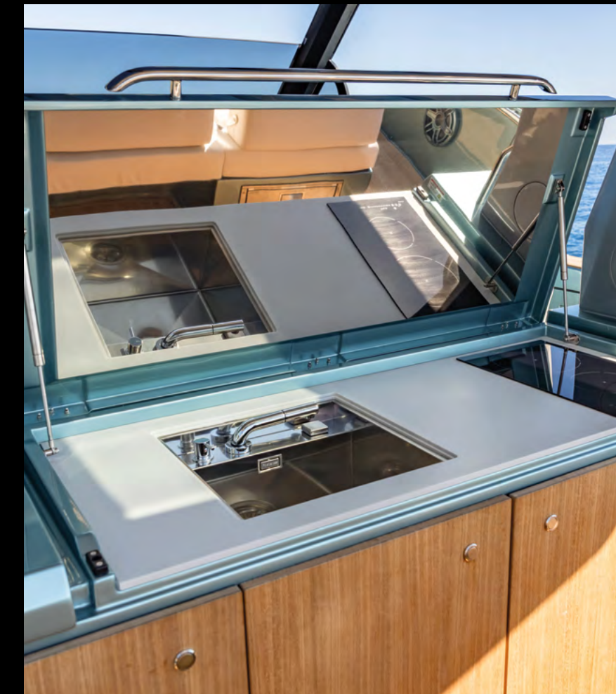
EXPANDED OUTDOOR GALLEY WITH INDUCTION HOB AND OPTIONAL BARBECUE / CUCINA ESTERNA AMPLIATA CON PIASTRA A INDUZIONE, POSSIBILITÀ DI AGGIUNTA BARBECUE