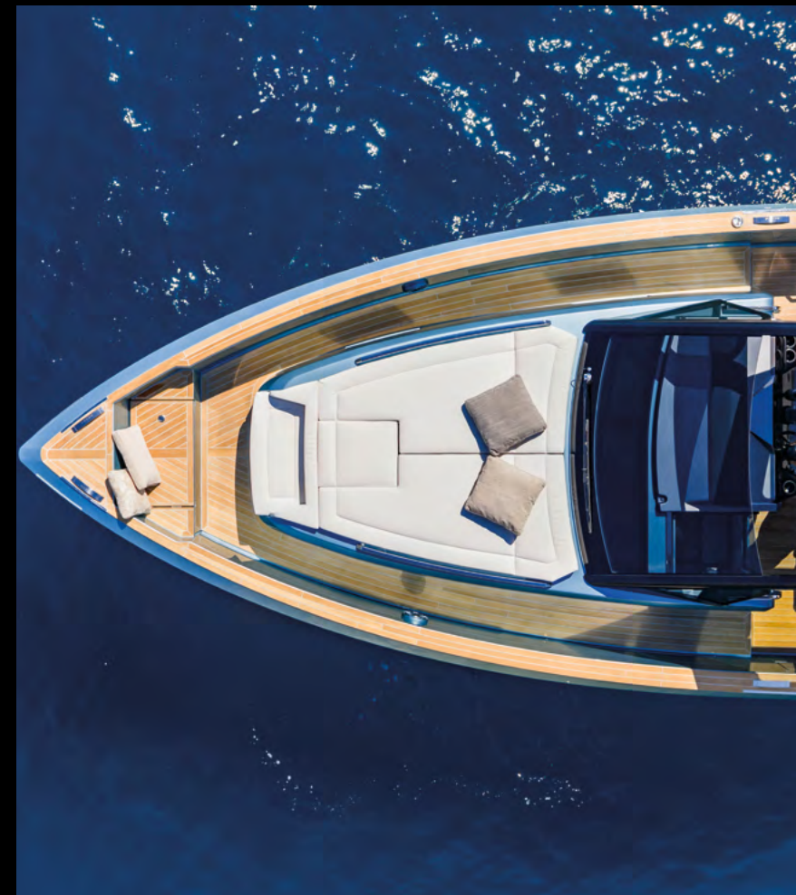
NEW BOW LOUNGE WITH FORWARD- FACING BENCH / NUOVA LOUNGE A PRUA CON PANCA FRONTE MARE