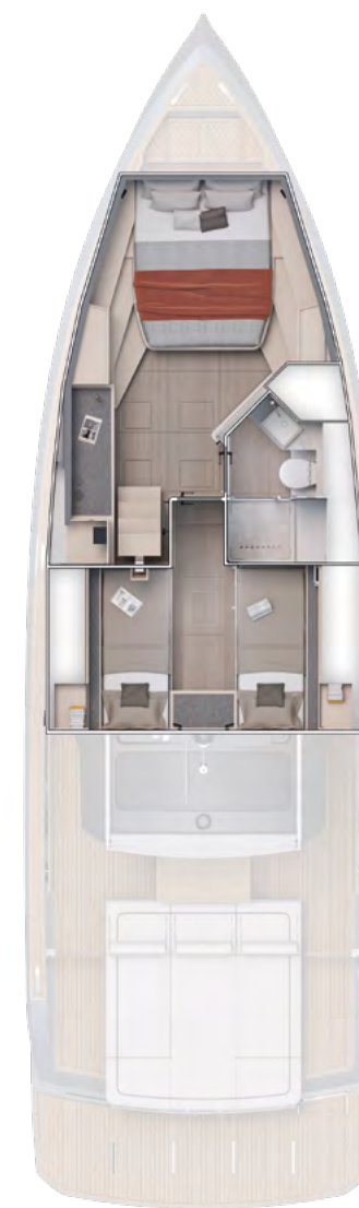
Optional Layout 1