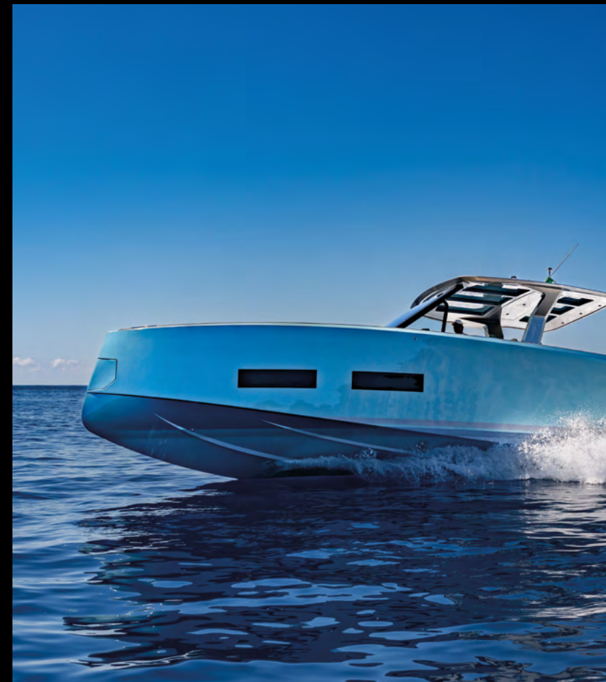
LARGE HULL WINDOWS FOR NATURAL LIGHT AND SEA VIEWS / AMPIE FINESTRE A SCAFO PER LUCE NATURALE E VISTA MARE