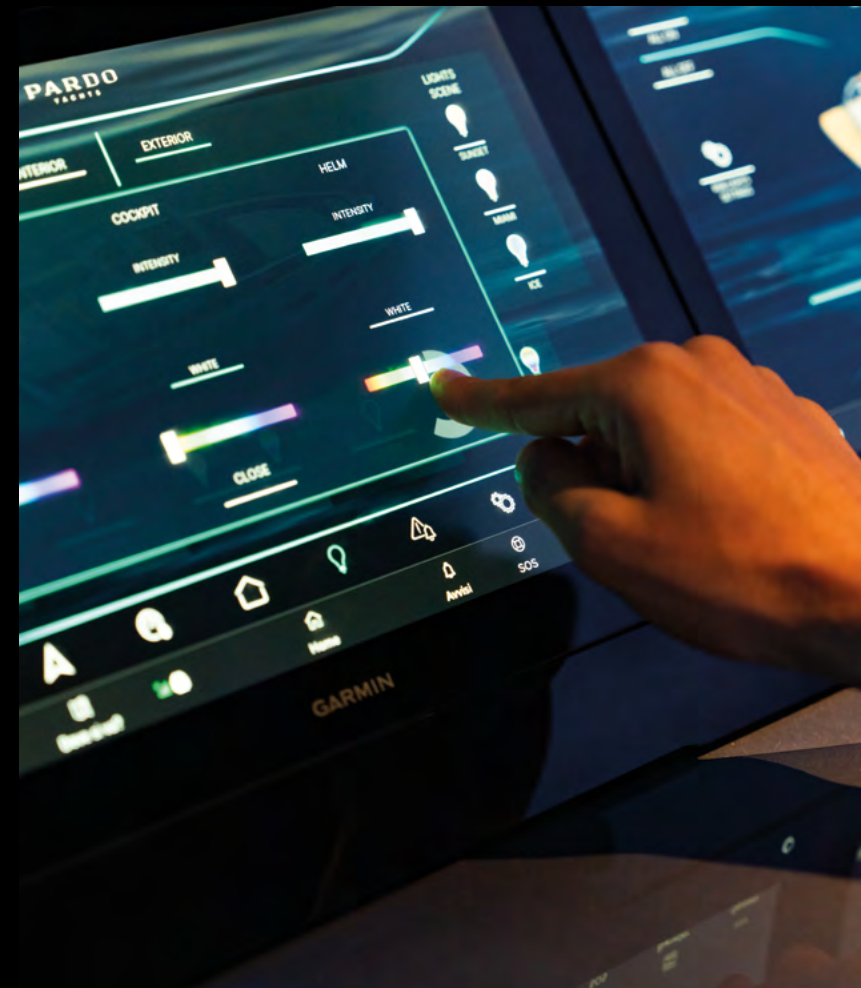
HIGH-TECH DASHBOARD WITH TRIPLE TOUCHSCREEN AND JOYSTICK / DASHBOARD TECNOLOGICO CON TRIPLO TOUCHSCREEN E JOYSTICK