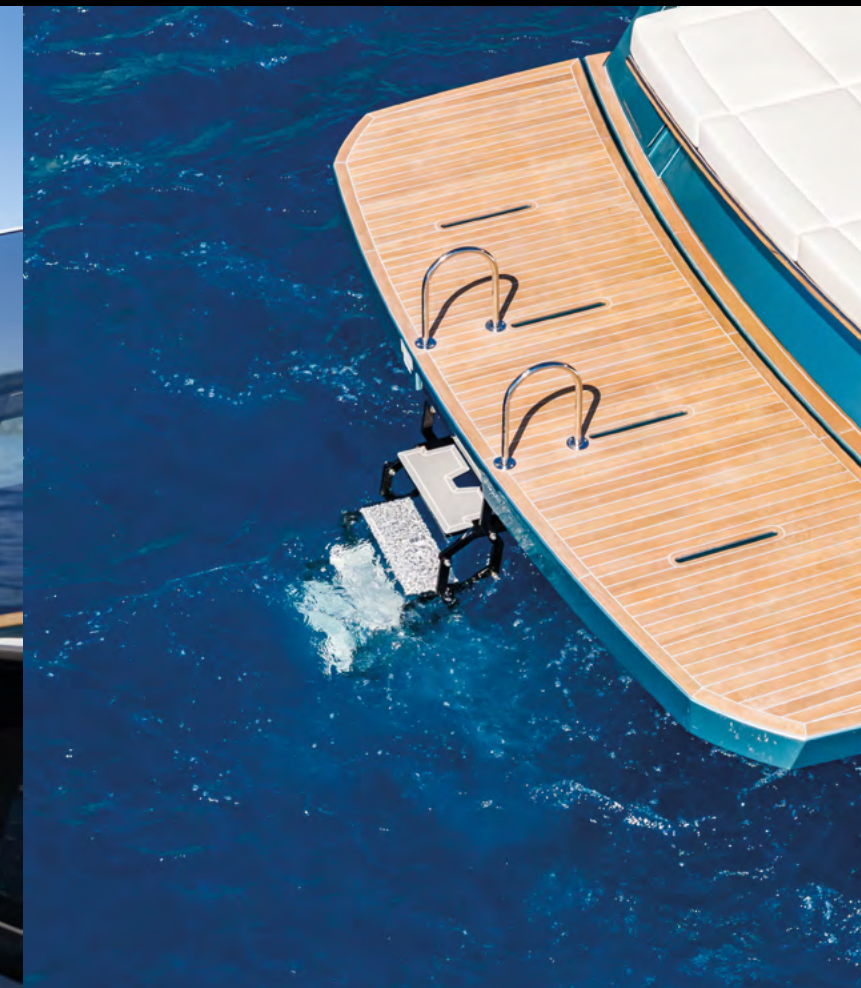
HYDRAULIC UP & DOWN SWIM PLATFORM WITH ELECTRIC BATHING LADDER / SPIAGGETTA IDRAULICA UP & DOWN CON SCALETTA BAGNO ELETTRICA