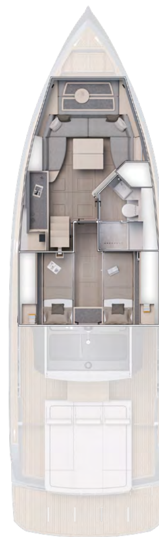
Optional Layout 2