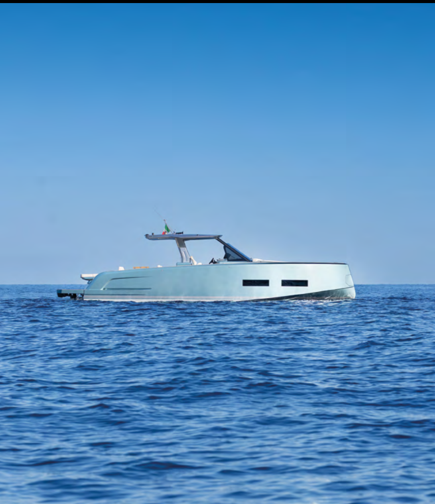
FLOWING SHEERLINE / SHEERLINE DISCENDENTE