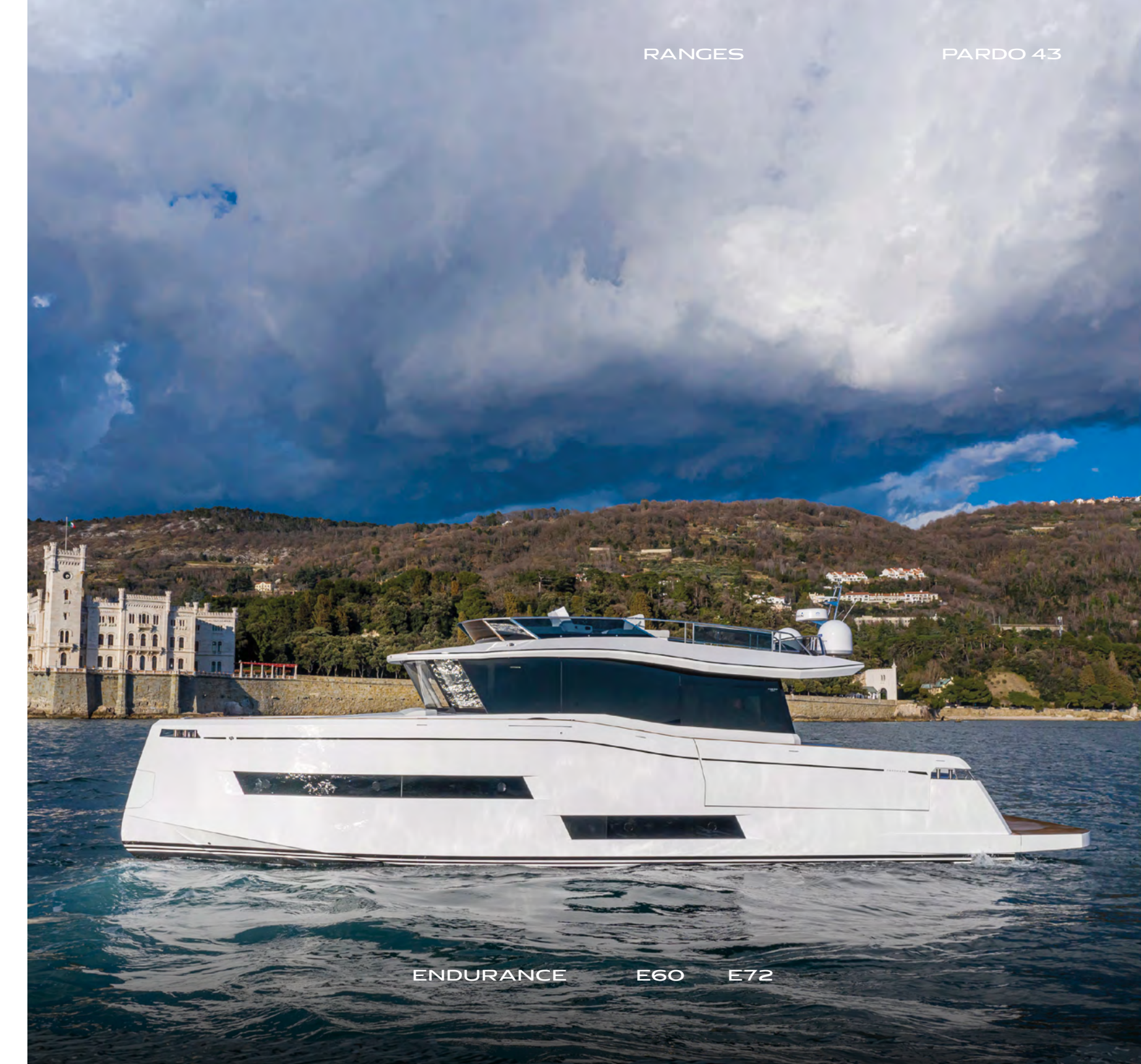
ENDURANCE E60 E72

La gamma Endurance è pensata per le lunghe tratte, grazie agli ampi spazi, ad una timoneria high-tech all'avanguardia e alla navigazione silenziosa. Il design presta particolare attenzione alle linee eleganti, alle forme regolari dello scafo e alla vivibilità interna, favorendo il comfort di bordo.