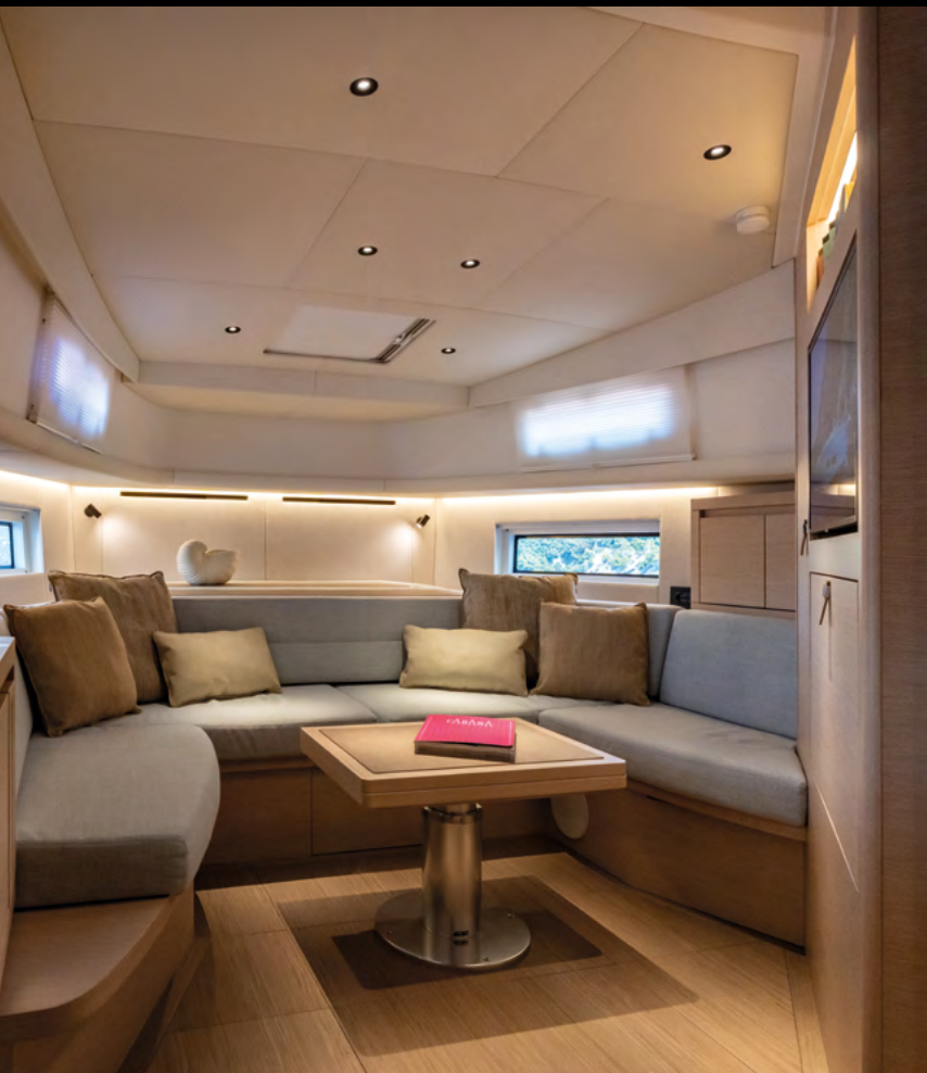
MODULAR INTERIORS: DINETTE WITH FIXED OR CONVERTIBLE BED / INTERNI MODULARI: DINETTE CON LETTO FISSO O TRASFORMABILE