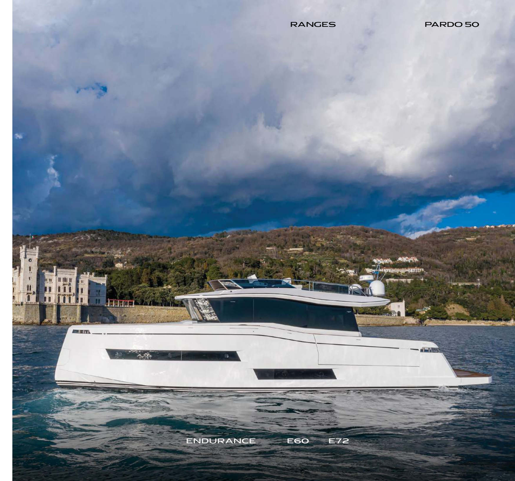
ENDURANCE E60 E72

La gamma Endurance è pensata per le lunghe tratte, grazie agli ampi spazi, ad una timoneria high-tech all'avanguardia e alla navigazione silenziosa. Il design presta particolare attenzione alle linee eleganti, alle forme regolari dello scafo e alla vivibilità interna, favorendo il comfort di bordo.