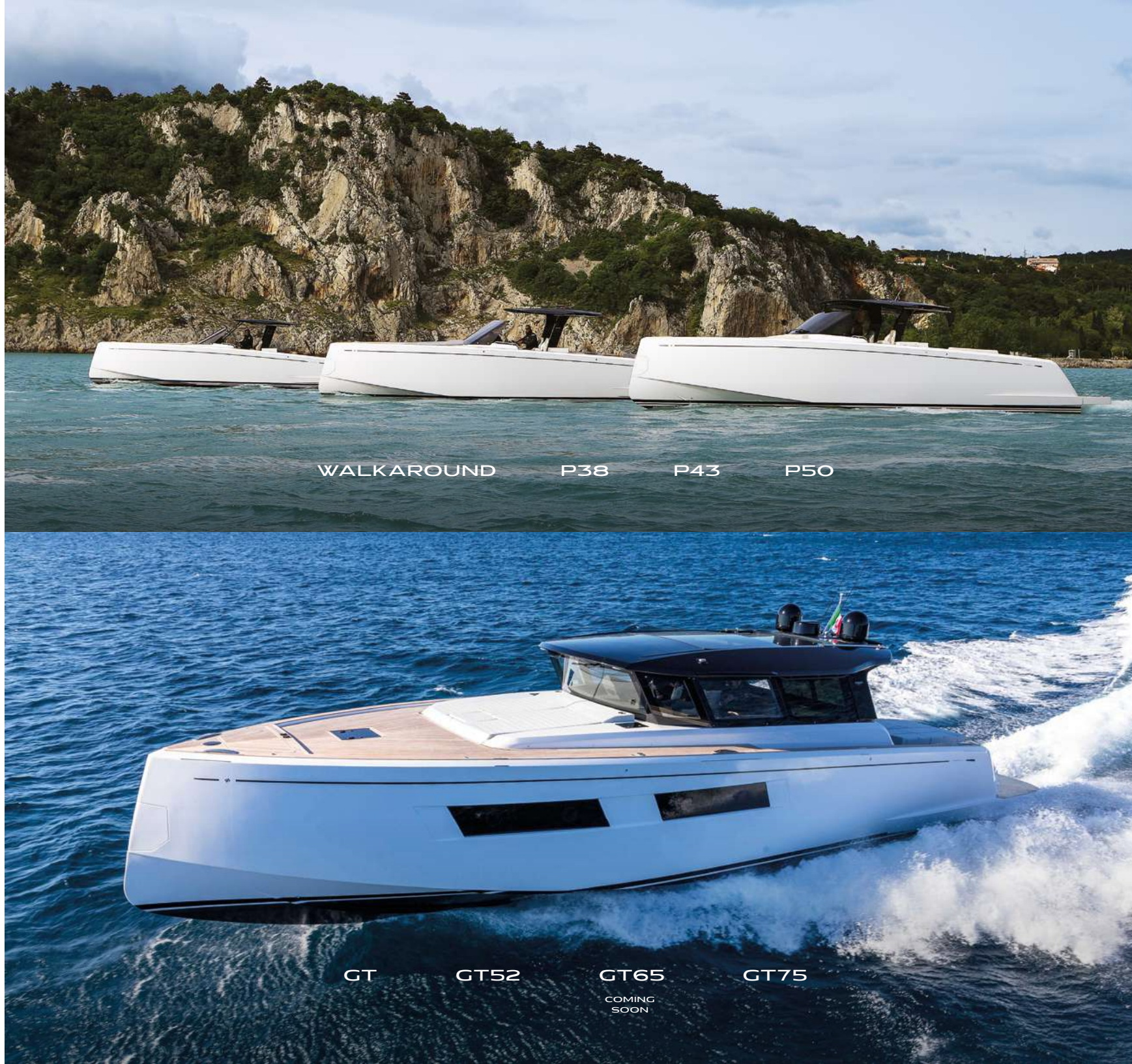
WALKAROUND P38 P43 P50

Una gamma che si va a posizionare tra la gamma Walkaround e quella Endurance rivolgendosi a un segmento di armatori alla ricerca di volumi ancora più vivibili e confortevoli rispetto agli attuali modelli walkaround, ma senza rinunciare alle performance.